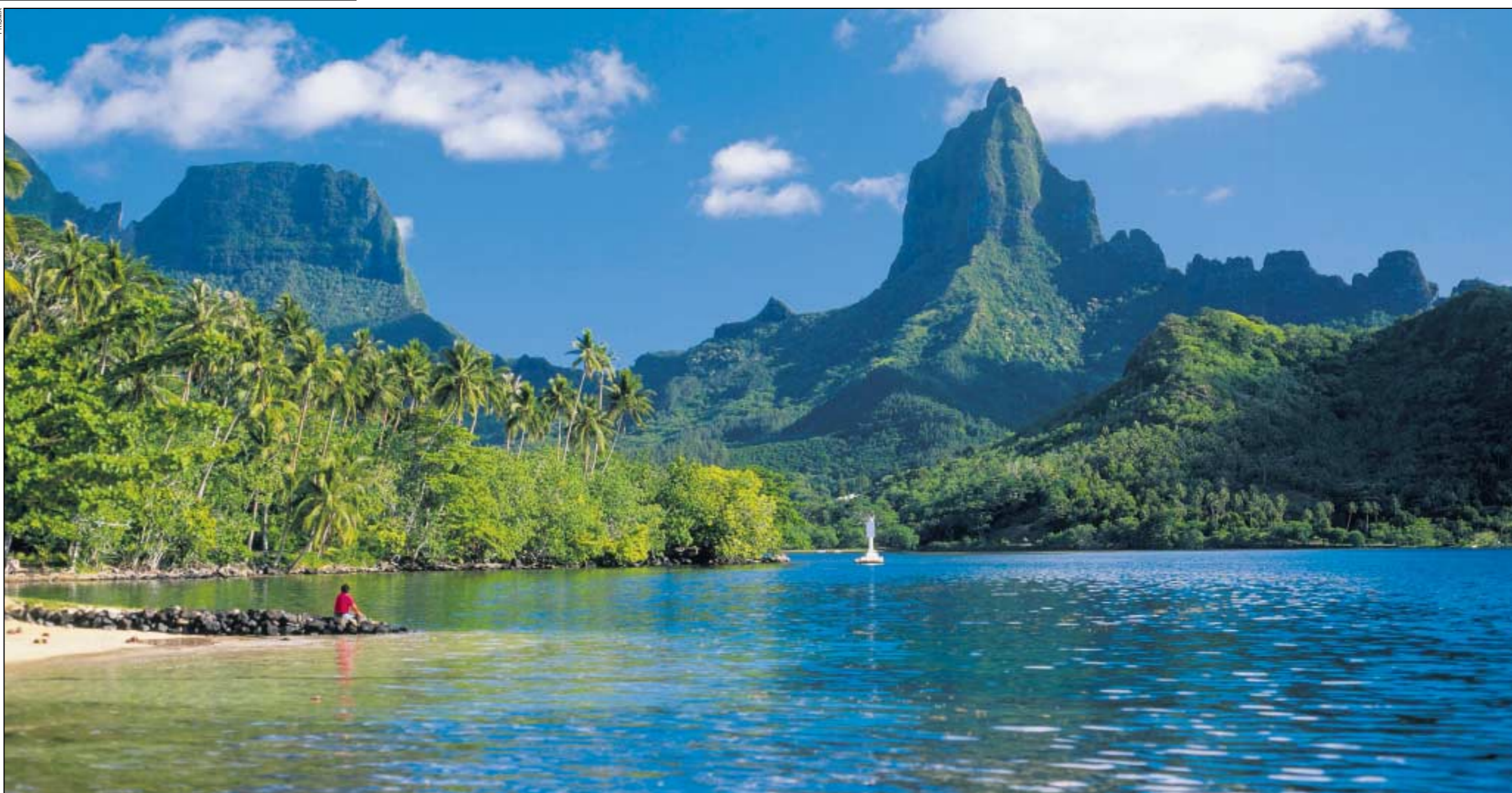
Dichte Vegetation, schroffe Felsen, türkises Meer: Auf Moorea gibt es unzählige paradiesische Stellen. (Bild auf der Titelseite: Die Bucht von Anahoe auf Nuku Hiva, die nur per Boot oder zu Fuss erreichbar ist.)

Abschied Moorea, Ankunft Nuku Hiva. Die Insel gehört zu den Marquesas, der nördlichsten Inselgruppe Französisch-Polynesiens. Sie liegt rund 2000 Kilometer nördlich der Gesellschaftsinseln, zu denen Tahiti gehört. Beim Anflug auf die Insel sieht man hohe, nackte Felsen, an die das Meer brandet. Der Flughafen liegt im spärlich bewohnten Nordwesten, der mit einer (noch nicht vollständig asphaltierten) Strasse