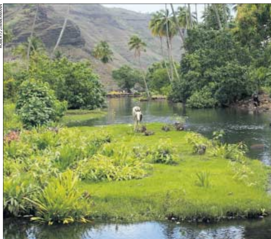
Idyllische Szene mit Pferd auf der Insel Nuku Hiva in der Nähe von Taipiva.