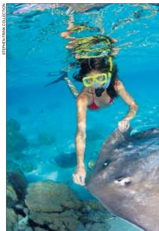
Beliebtes Vergnügen auf Moorea: Das Rochenfüttern.