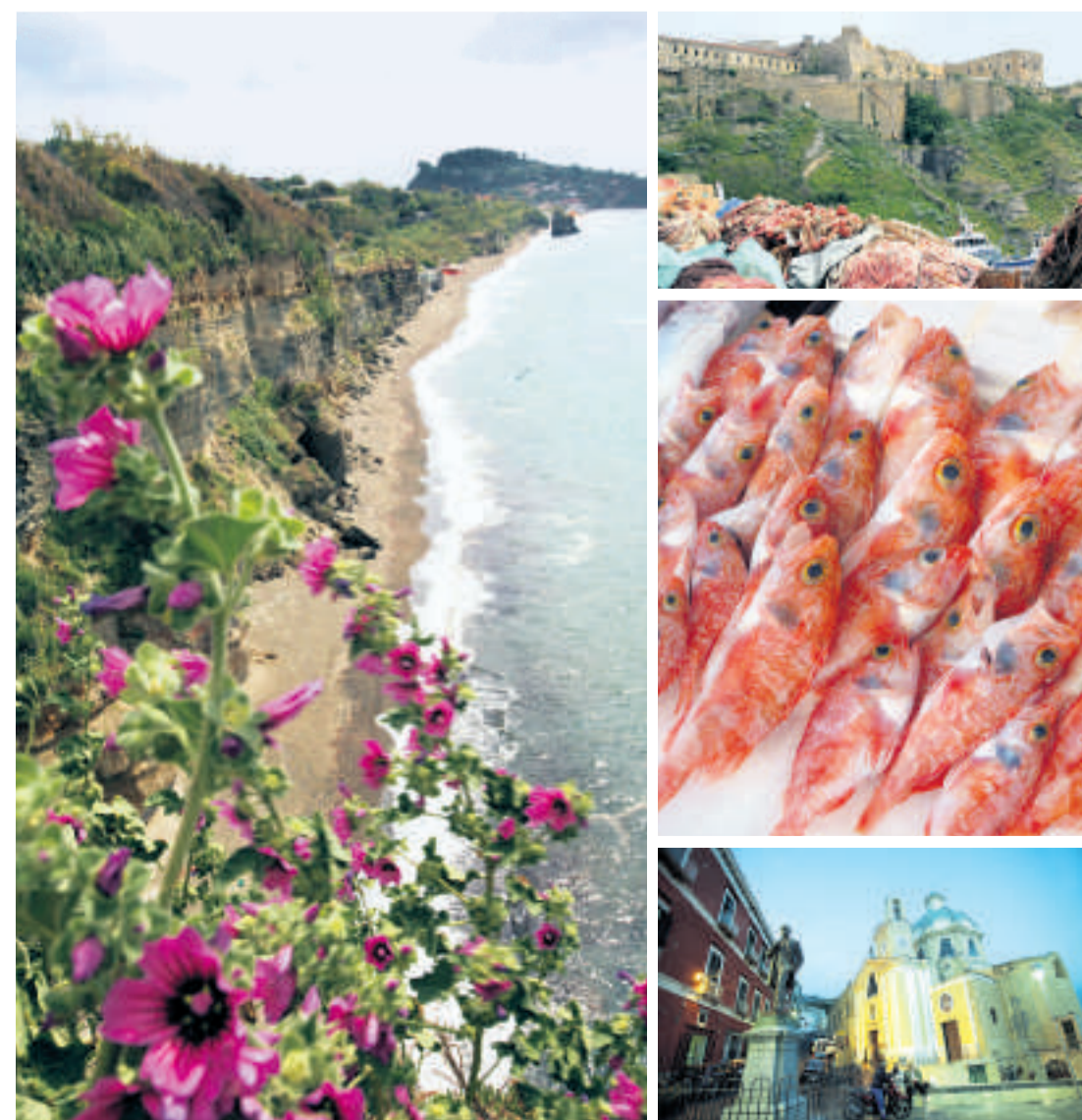
Einladende Küste: Der Strand von Ciraccio. Ehemaliges Gefängnis: Die Burg Terra Murata. Marktangebot: Guter Fang. Strassenszene: Kirchenplatz in Procida