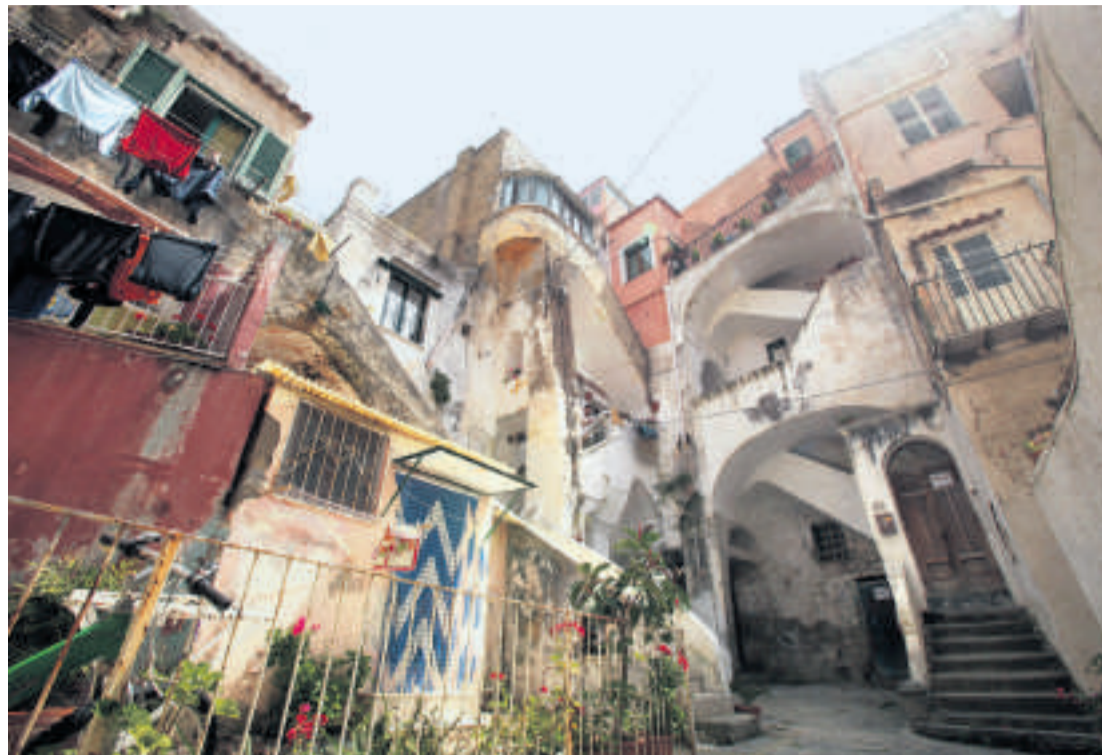
Seeleute brachten Stile aus aller Welt mit: Architettura spontanea

Judith Schatansky: «Atlas der abgelegenen Inseln. Fünfzig Inseln, auf denen ich nie war und niemals sein werde», Mareverlag, 143 Seiten, 52 Franken