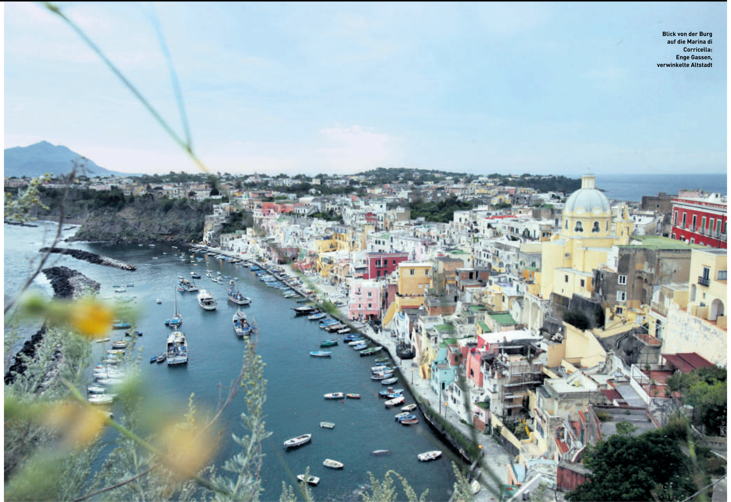
Blick von der Burg auf die Marina di Corricella: Enge Gassen, verwinkelte Altstadt